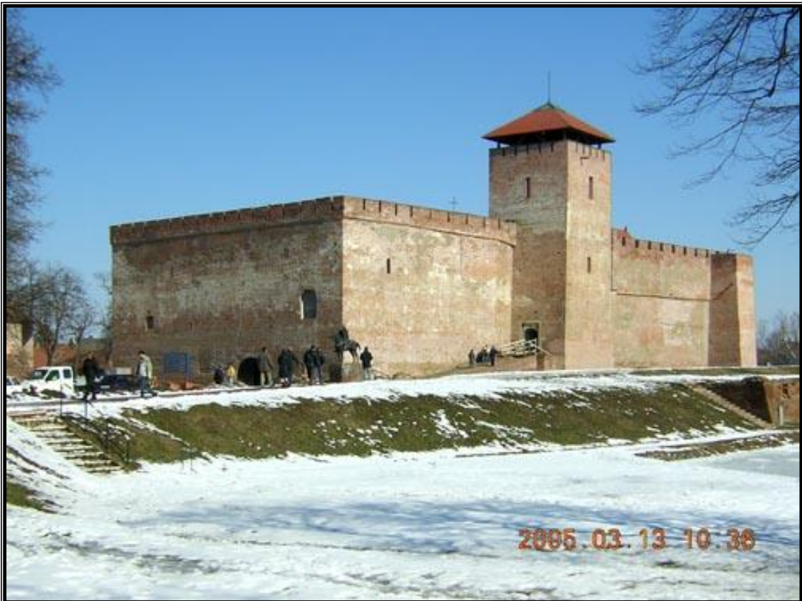
7. ábra: A gyulai vár ismert képe márciusi hóban