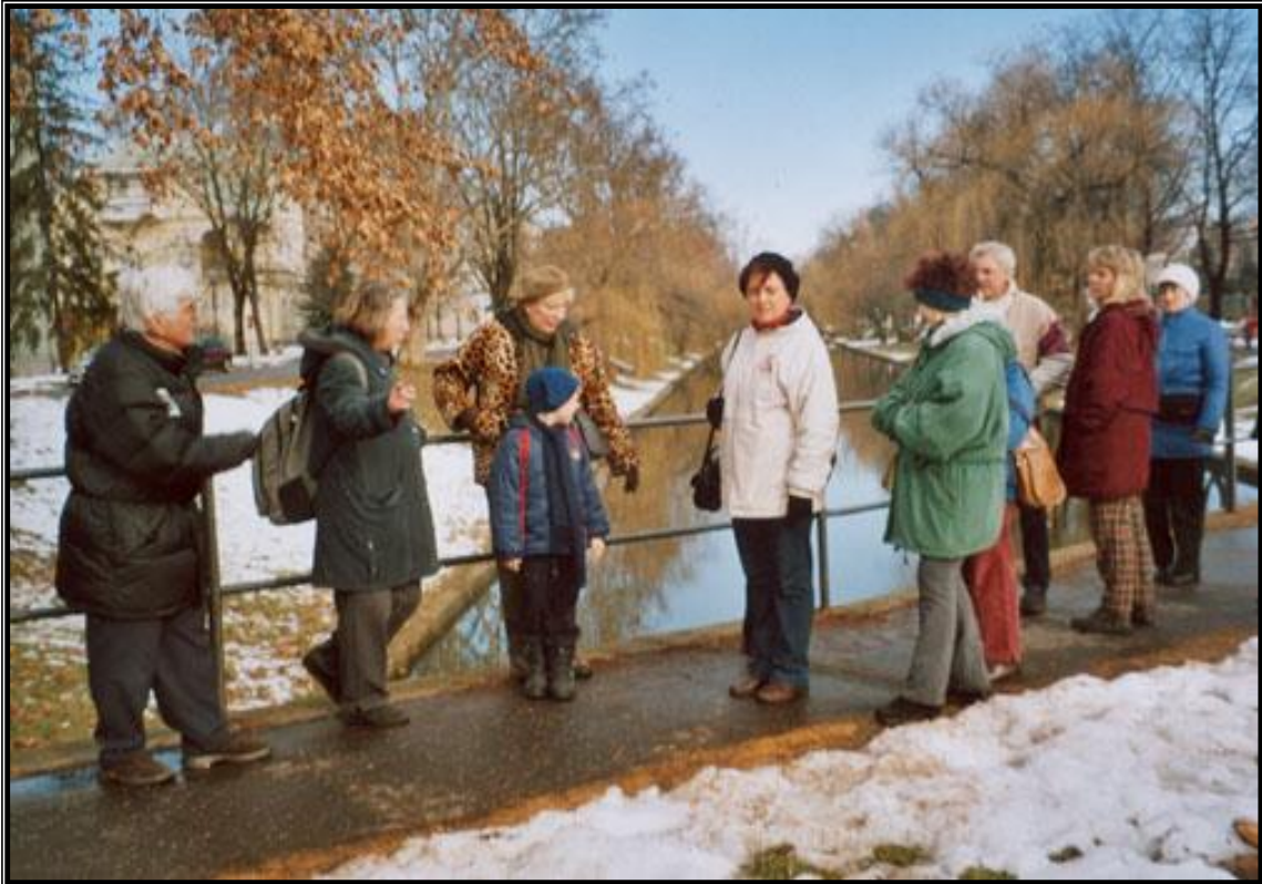
6. ábra: Az Élővíz-csatornánál