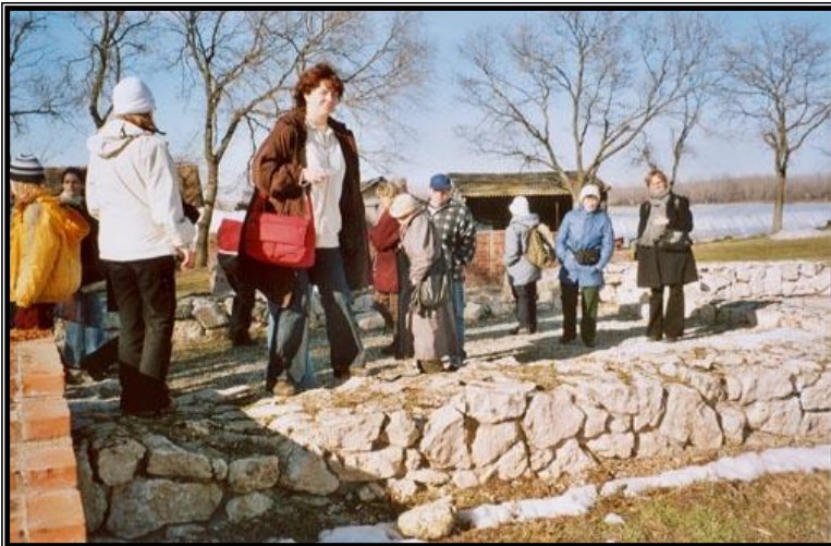
10. ábra: A szőregi romokon