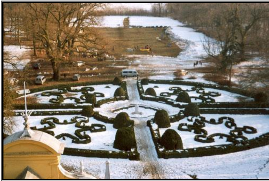
8. ábra: A szabadkígyósi kastélypark