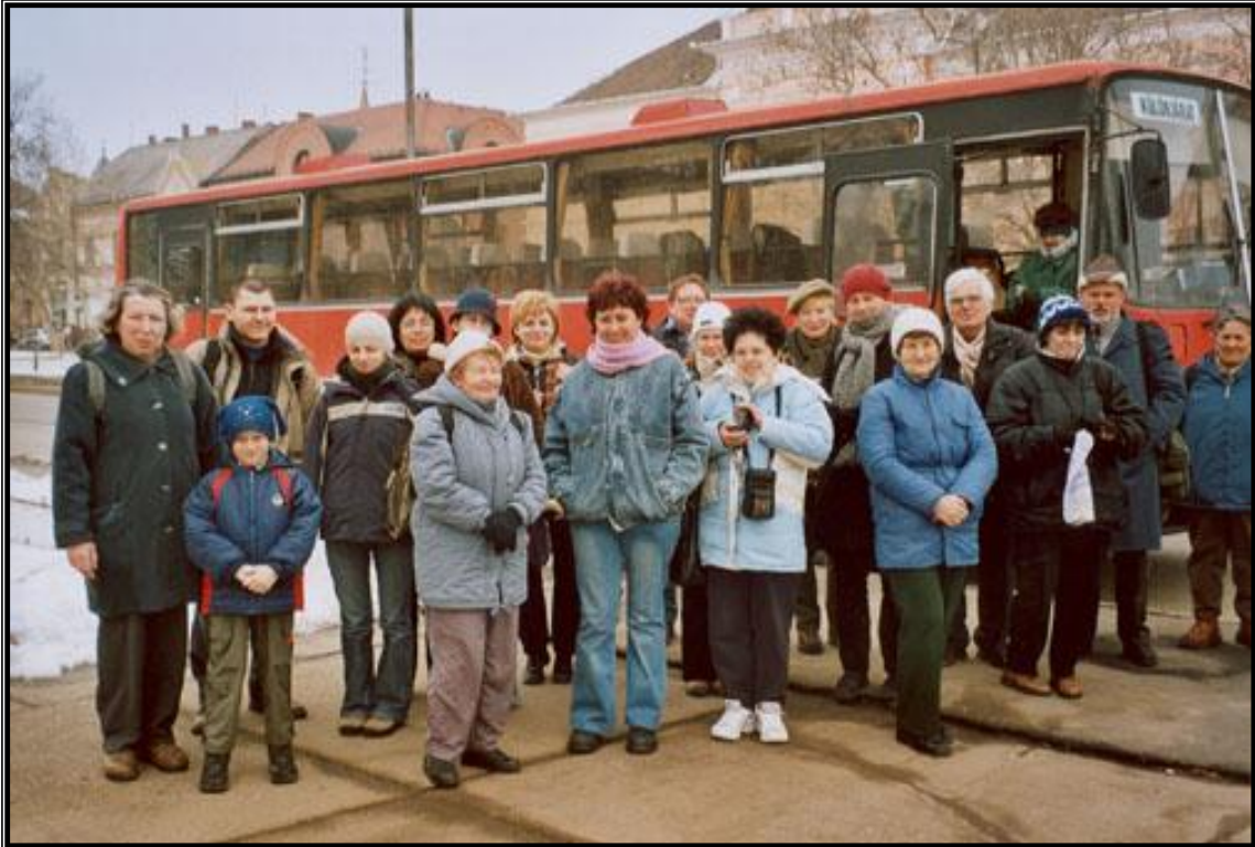
1. ábra: csoportkép a busszal