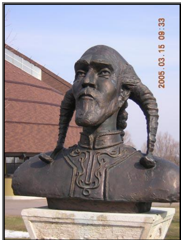
13. ábra: Aba Sámuel szobra Ópusztaszeren