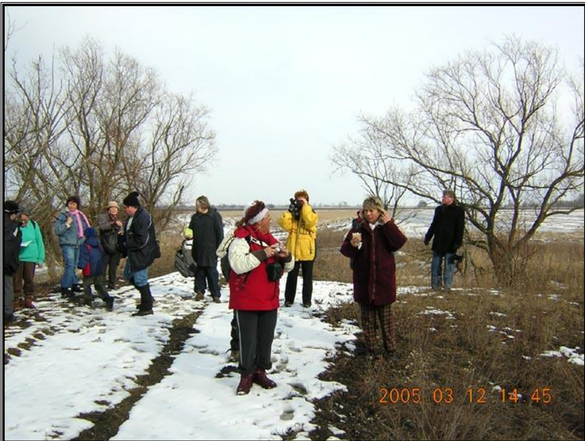
2. kép: Hóban és sárban a Kék-túrások