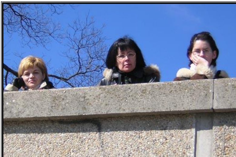
9. ábra: Szieszta a Tisza-parton