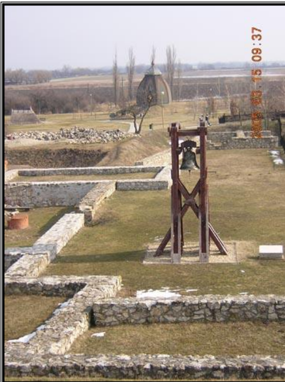
12. ábra: Ópusztaszer