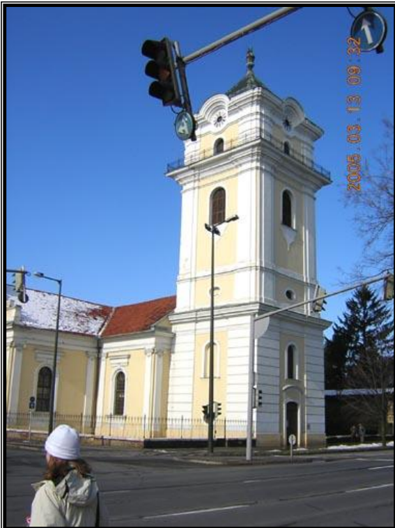
4. kép: A békéscsabai kistemplom