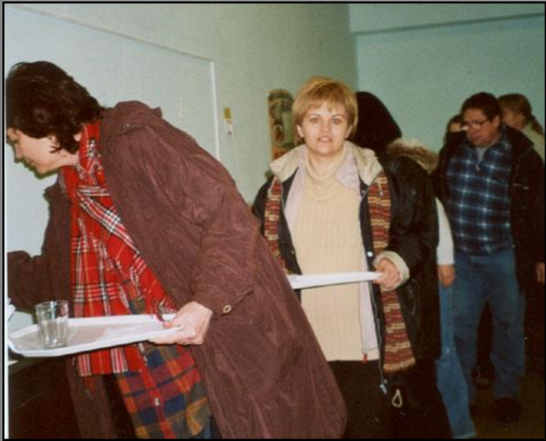
3. kép: Vacsora osztás Békéscsabán