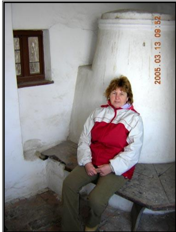
5. kép. Búboskemence a kistemplomban